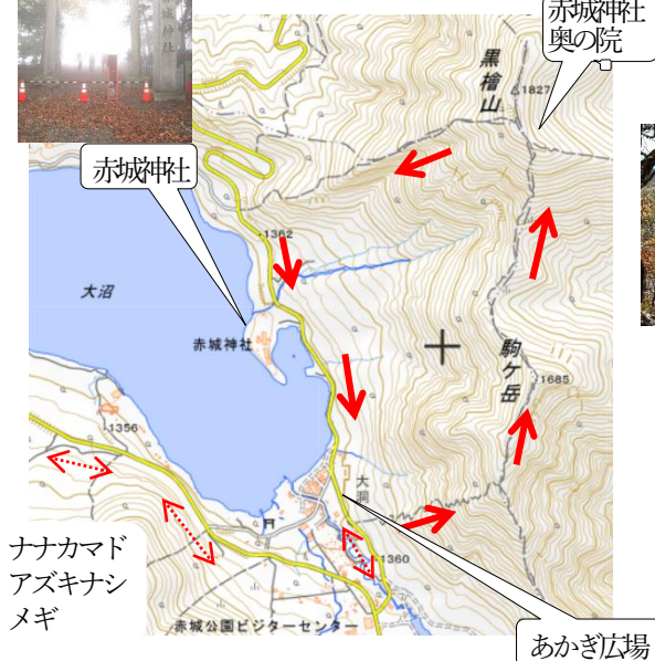
ナナカマド アズキナシ メギ